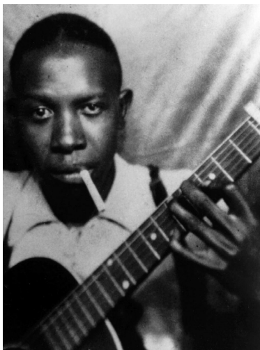
Una de las pocas imágenes que se conservan de Robert Johnson (1911-1938)

de su amigo en el álbum American Prayer . De ese trabajo es este tema, "Feast Of Friends" , en el que The Doors reinterpreta el famoso Adagio de Tomaso Albinoni.