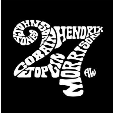
El número 27 conteniendo los nombres de algunos de los integrantes del luctuoso Club 27