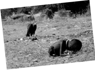
Fotografía de Kevin Carter, ganadora del premio Pulitzer en 1994

Apostando inútilmente y con los dioses riéndose de nosotros llegamos al final de la película El amor es un juego perdido.