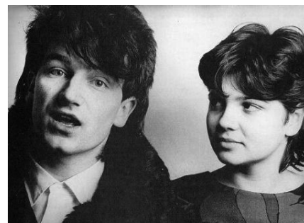
Bono y su esposa Ali Hewson, en una instantánea tomada a finales de la década de los 70

Volvemos a escuchar la famosa frase de Love Story , esta vez en la boca de Ryan O'Neal. A la salida del hospital donde el personaje de Ali MacGraw acaba de fallecer, el desconsolado O'Neal se encuentra con su acaudalado padre, opuesto desde el principio a su relación con la guapa proletaria. El padre todavía desconoce el trágico suceso y, al enterarse, pide perdón a su hijo, que le responde con la frase protagonista de hoy.